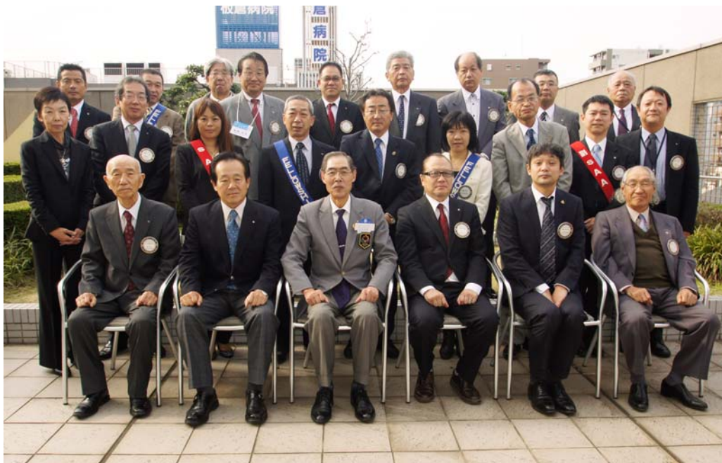
ガバナー公式訪問・クラブ協議会