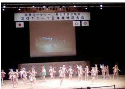
「たぬきばやし」 木更津第 1 小学校の皆様

今回の地区大会は、ホテルでなく、手作りの大会でしたが、地元クラブもてなしで素晴らしい大会でした、当クラブからの参加少なく寂しかったが少ない人数でも、参加された会員は大いにロータリーの魅力を感じたと思います。